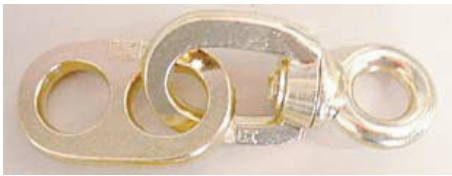
スイブルフックは、ABセットで使います。