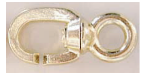
はずしだ状態 B 33 x 13mm 厚み5mm