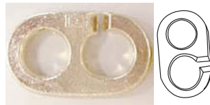
はずしだ状態 A 50 x 23mm 厚み5mm